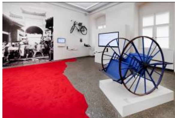
12. Ausstellungsansicht NI HAO LINZ NORDICO Stadtmuseum Linz