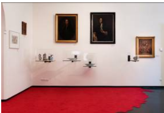
11. Ausstellungsansicht NI HAO LINZ NORDICO Stadtmuseum Linz