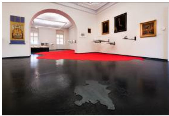
10. Ausstellungsansicht NI HAO LINZ NORDICO Stadtmuseum Linz