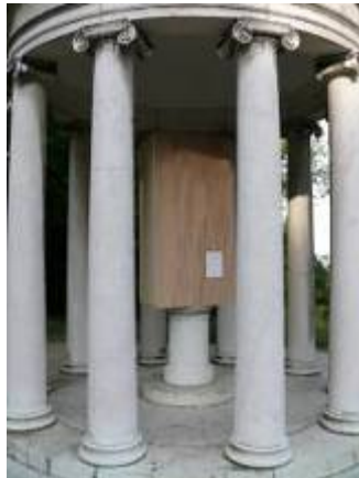
2. Kunstaktion "formlos" (Mai 2008) Realisierung im Rahmen von: "Hohlräume der Geschichte". Konzeption und Betreuung: R. Herter, Kunstuniversität Linz, K. Jedermann, Universität der Künste/ Berlin.