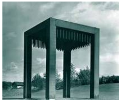
5. forum metall: Günther Uecker, Tisch der Austreibung (1977), © Helmuth Gsöllpointner