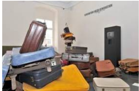
3. Ausstellungsansicht „Schlafzimmer“ – Generation nach Generation