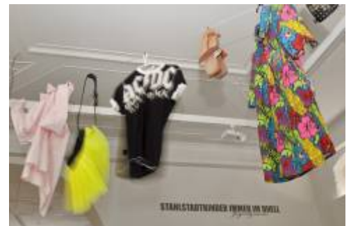
6. Ausstellungsansicht „Jugendzimmer“ – Stahlstadtkinder immer im Duell