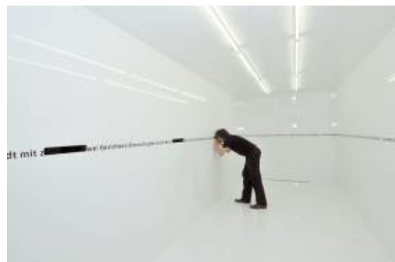
8. Ausstellungsansicht „Rumpelkammer“ Guter Nazi – Böser Nazi