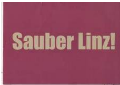
4. Aufkleber "Sauber Linz" (2006), © qujOchÖ