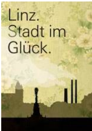
1. Linz. Stadt im Glück, 5. Juni – 13. September 09