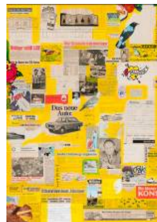
9. Kurt Lackner Bellevue , 2009 NORDICO Stadtmuseum Linz