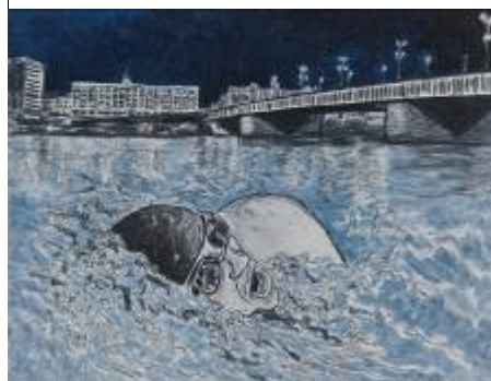
8. Franz Anton Obojes Nachtschwimmer I , 2009 NORDICO Stadtmuseum Linz