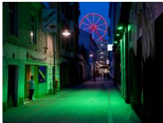
5. Jens Sundheim Ohne Titel, aus der Serie Reflecting City , 2009 NORDICO Stadtmuseum Linz