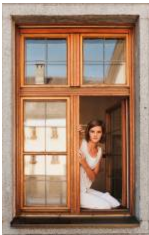
4. Lies Maculan Aus der Serie Die Klosterschülerinnen , 2008 NORDICO Stadtmuseum Linz