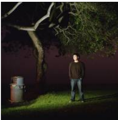
7. Katharina Gruzei Untitled 4 , aus der Serie Fullmoon , 2006–2009 NORDICO Stadtmuseum Linz