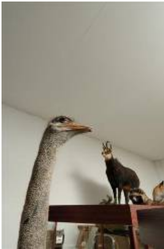
1. Norbert Artner Trophäe III , 2008 NORDICO Stadtmuseum Linz